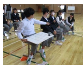
[改善点を話し合います]