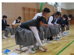
[カードを順に渡します]