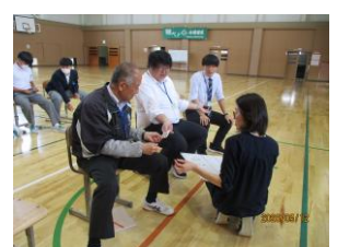
[教員チームも真剣です]