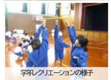
学年レクリエーションの様子