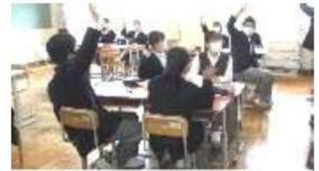
学級目標決めの学級会の様子

自分の夢に向かって目標をもち、舟橋で出会った仲間を大切にしながら、充実した日々を送ることができるよう、学年スタッフ一同協力し、生徒達を支えていきます。1年間よろしくお願ひいたします。